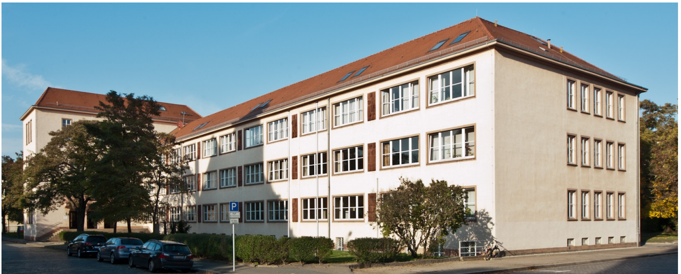
Unser Institut in der Lumumbastraße / Our institute on Lumumbastraße