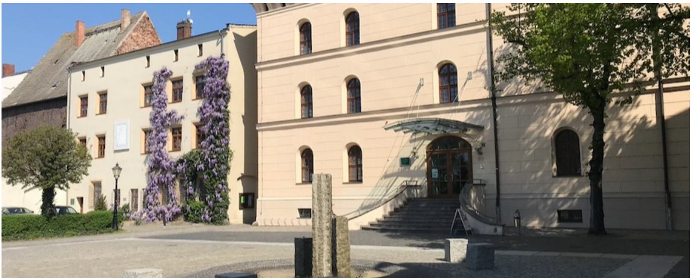
Institut für deutsche Sprache und Kultur e. V. in der Stiftung Leucorea