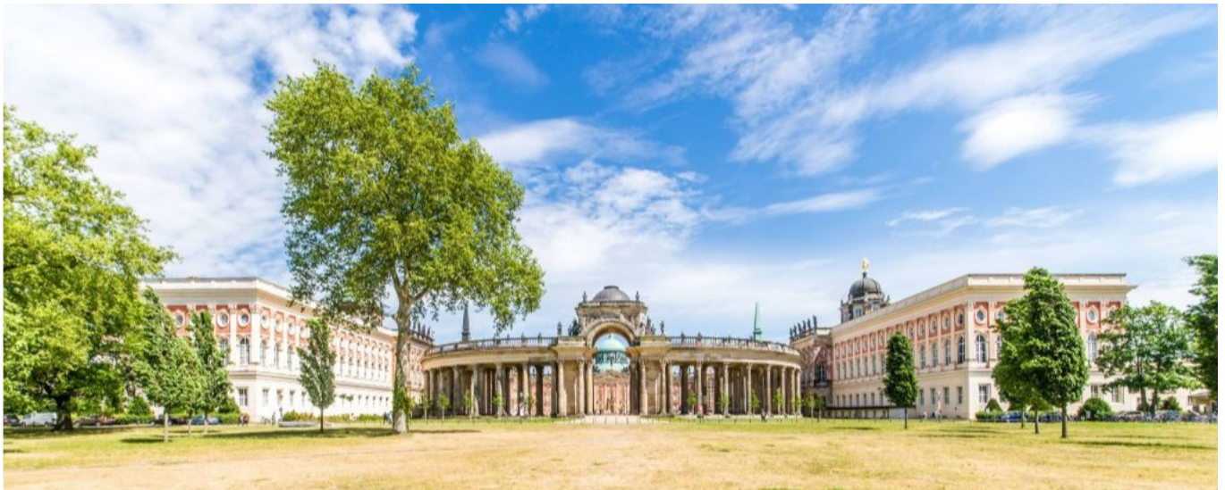
University of Potsdam