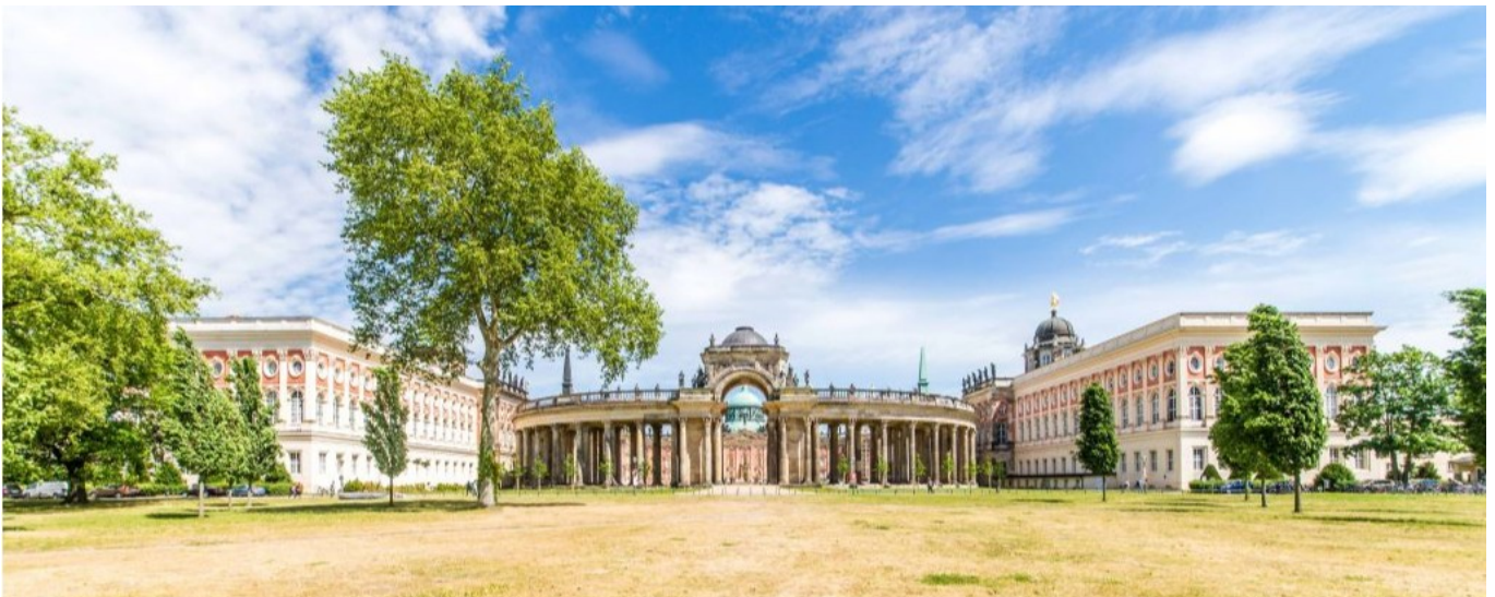
University of Potsdam